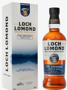
Original Triple Oak 40 %

Whisky najbardziej uniwersalne. Leżakowało w trzech rodzajach dębowych beczek.