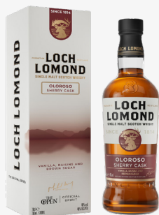
Original Sherry Cask 40 %

Ostatni rok leżakowało w dębowych beczkach po słodkim, mocnym winie Sherry Oloroso.