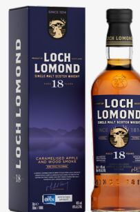
18 YO 46 %

Whisky z gatunku single malt dla koneserów. Eleganckie, dojrzałe, o głębokim, słodkim charakterze, podkreślonym subtelną nutą torfowego dymu. Długi okres dojrzewania w beczkach po bourbonie pozwolił na pełne rozwinięcie.