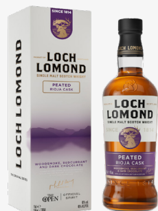
Original Peated Rioja 40 %

Whisky dla „znudzonych klasyką”. Finiszowane w beczkach pierwszego napętnienia po czerwonym winie Rioja. Słód jęczmienny wykorzystywany do produkcji, suszony za pomocą dymu torfowego.