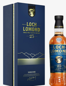
25 YO 46 %

Ikona marki. Wyjątkowe whisky single malt. Powstaje z różnych stylów destylatów – torfowych i nietorfowych i dojrzewających w beczkach z amerykańskiego dębu: first-fill, refill oraz re-charred.