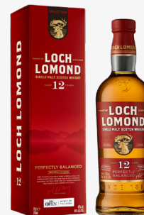
12 YO 46 %

Whisky z połączenia destylatów dojrzewających w beczkach po bourbonie oraz w beczkach z amerykańskiego dębu poddanych ponownemu wypaleniu.